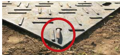
L字アンカー施工例